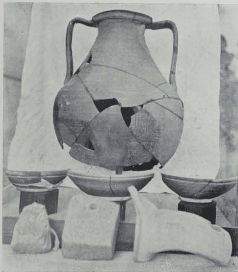
Fig. 157. — Guissona. Col·lecció Camps. Ceràmica de la Malesa