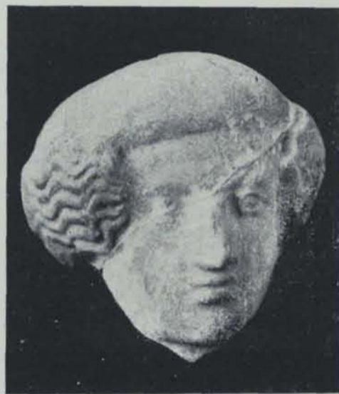
Fig. 160. — Ibiça. Necròpolis del Puig des Molins. Terra cuita

També han trobat, als voltants del poble, sepulcres excavats en la roca, probablement d'època cristiana.