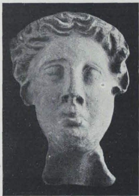
Fig. 159. — Ibiça. Necròpolis del Puig des Molins. Terra cuita

nombrosos objectes, entre els quals hi ha pondus, fragments de tègules, fragments de ferro, molins de mà i, sobre tot, ceràmica ibèrica pintada, fragments de terra sigillata i diferents varietats de ceràmica comú. A l'estació de la Malesa, en la part baixa de la costa de la montanya, es troben restes de parets i ceràmica ibèrica pintada, campaniana i terra sigillata ; barrejats amb ossos d'animals i cendres, sortiren els següents vasos, fets a torn,